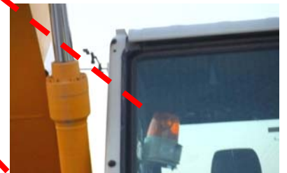
ブザー付パトライト取付例